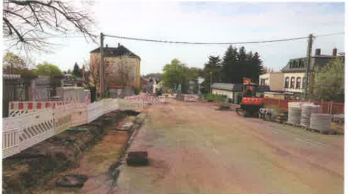
Der Umbau der Chemnitzer Straße hat planmäßig am 19. April begonnen. Das Bauende ist für August vorgesehen.