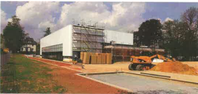
Die Arbeiten an den Außenanlagen der neuen Turnhalle gehen zügig voran.

Alle begonnenen Baumaßnahmen, wie die Fertigstellung der Zweifeld-Sporthalle, der Ausbau der Goethestraße und Vater-Jahn-Straße sowie der Chemnitzer Straße und der Hochwasserschutz an unserem Bach werden fortgesetzt und beendet.