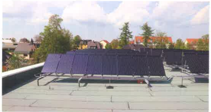
Die Solarthermieanlage, mit der künftig auch das Wasser im benachbarten Freibad beheizt werden soll, wurde auf dem Dach der Turnhalle installiert.