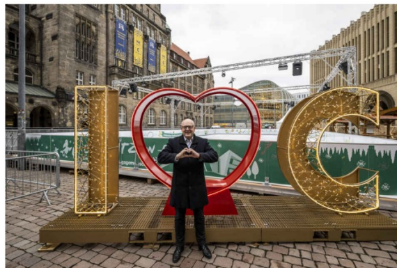
Oberbürgermeister Sven Schulze (50, SPD) hat am Mittwoch den beleuchteten Fotopoint mit dem Schriftzug "I love C" auf dem Chemnitzer Neumarkt eingeweiht.