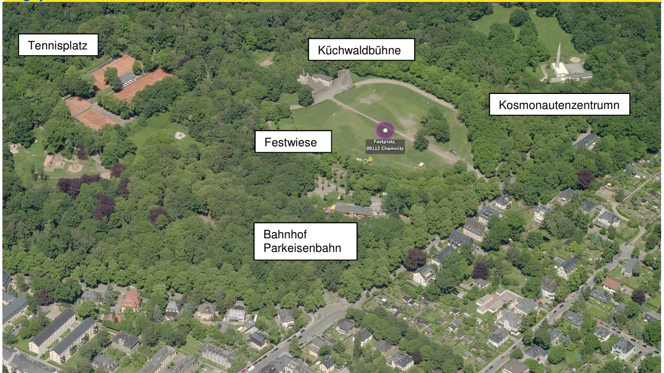
Küchwald mit angrenzender Wohnbebauung im Süden