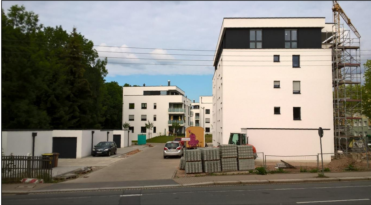
Foto der vier Mehrfamilienhäuser vom 10.06.2017

Lebensmittelmärkte in den heutzutage vorherrschenden Größenordnungen, die insbesondere durch den B-Plan ausgeschlossen werden sollten, da von ihnen eine Gefährdung der oben genannten zentralen Versorgungsbereiche ausgegangen wäre, sind durch die Errichtung der Mehrfamilienhäuser mangels bebaubarer Flächen nicht mehr möglich.