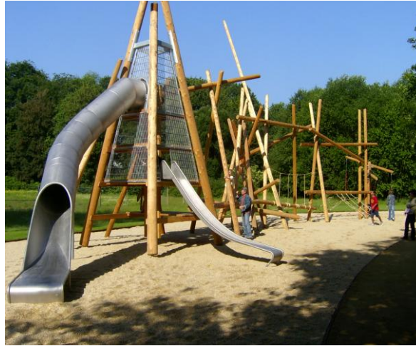
2. Stadtpark/Großer Teich